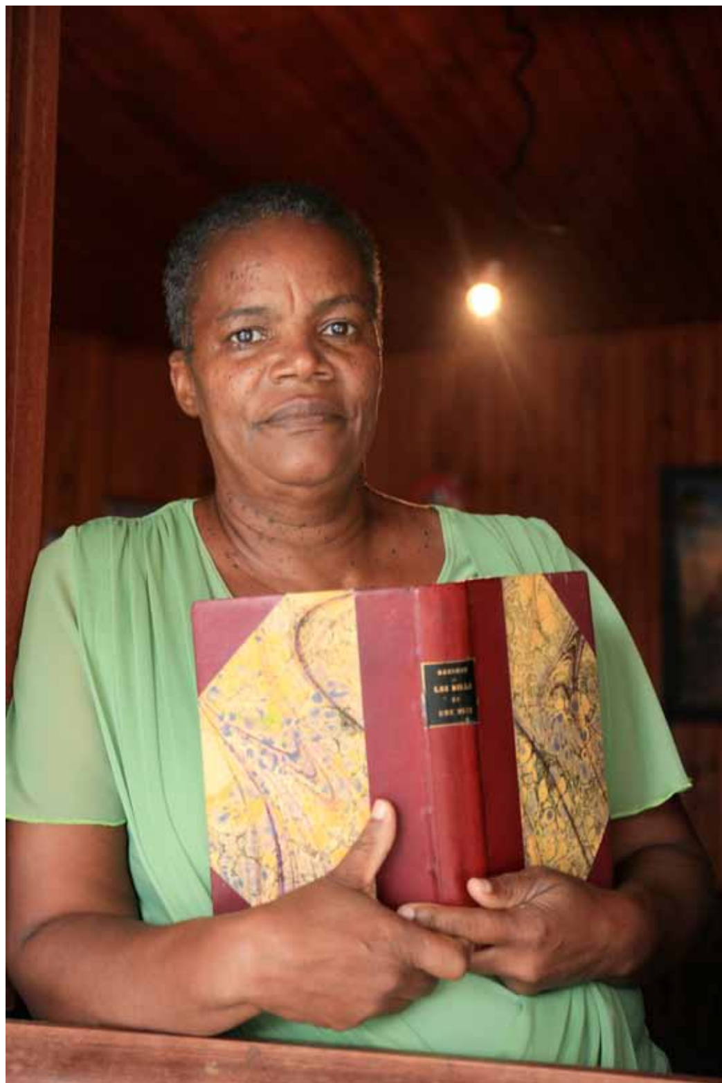
Félicité Reliure de livres Le Robert