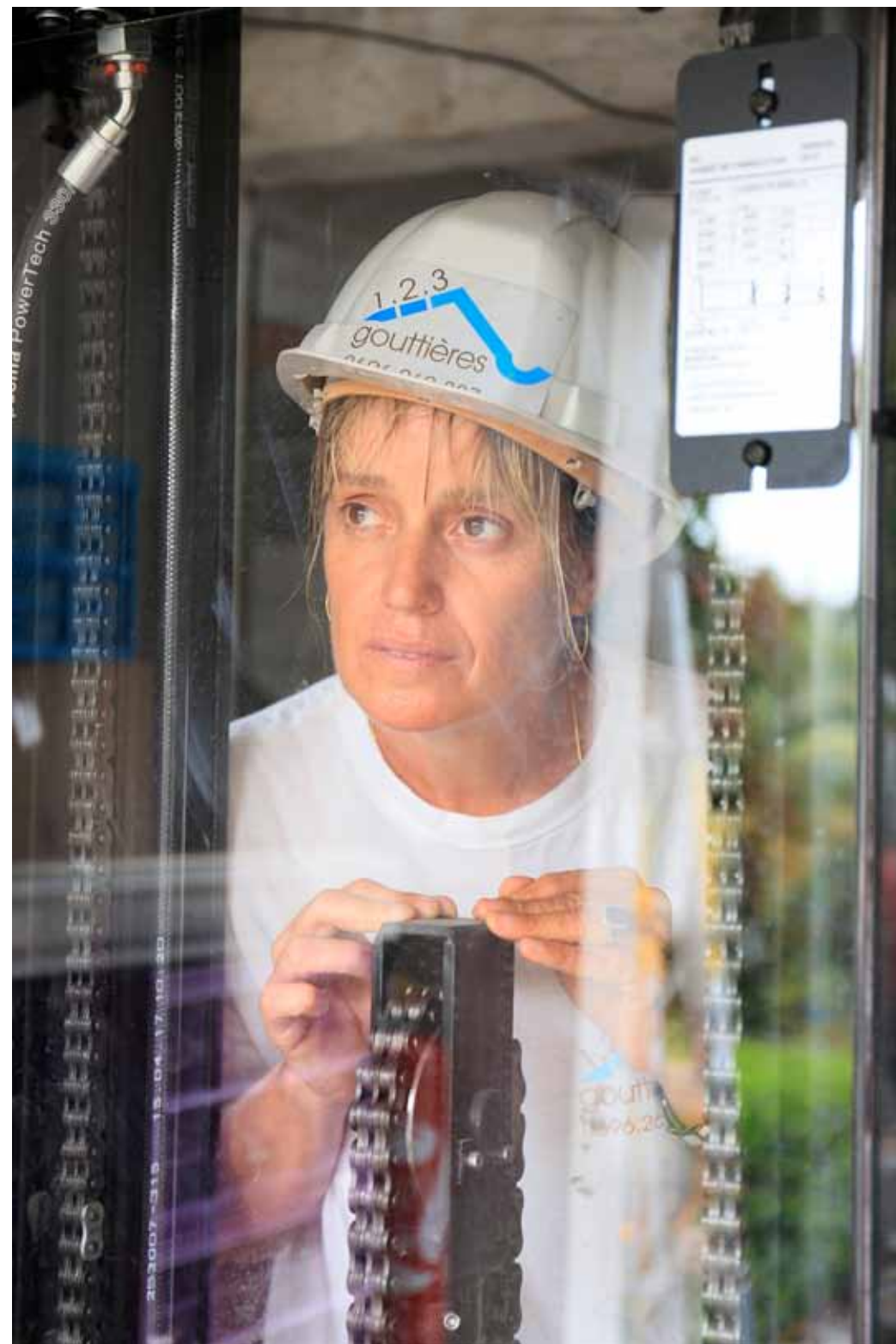
Sandrine Fabrication de Gouttières à Sainte Luce