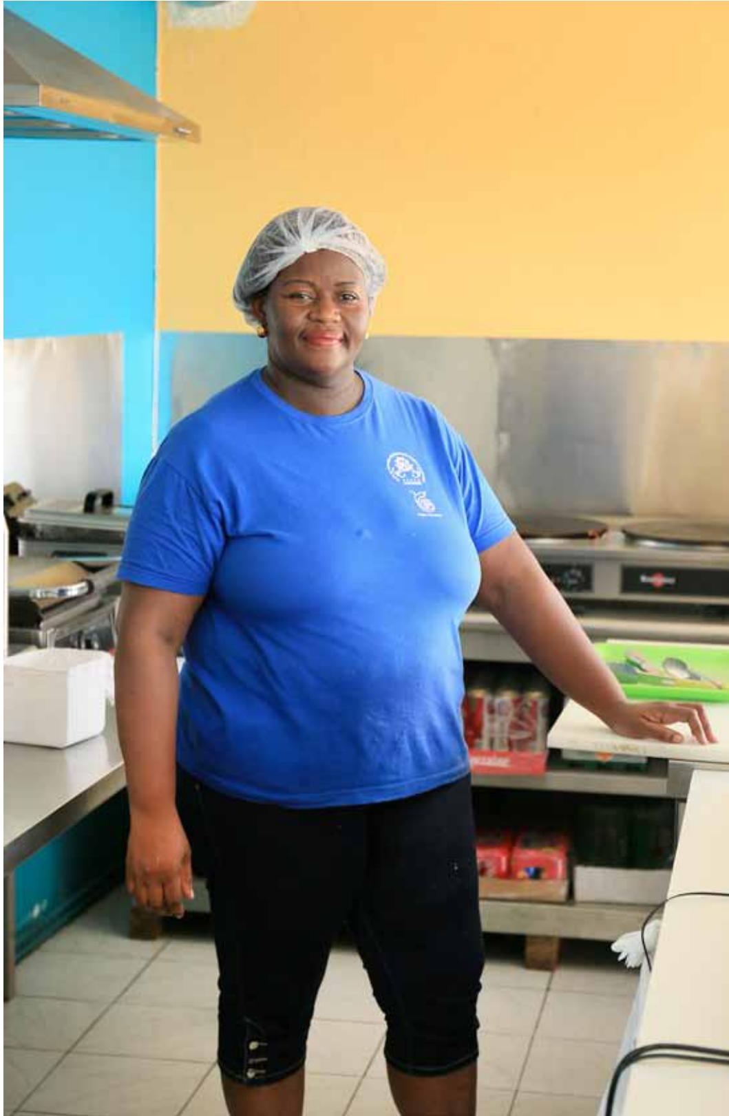
Claudine Crêperie Snack Rivière Salée