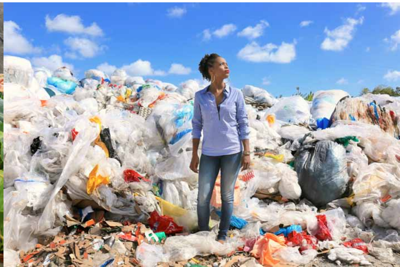
Séverine .Traitement Généralisé des déchets