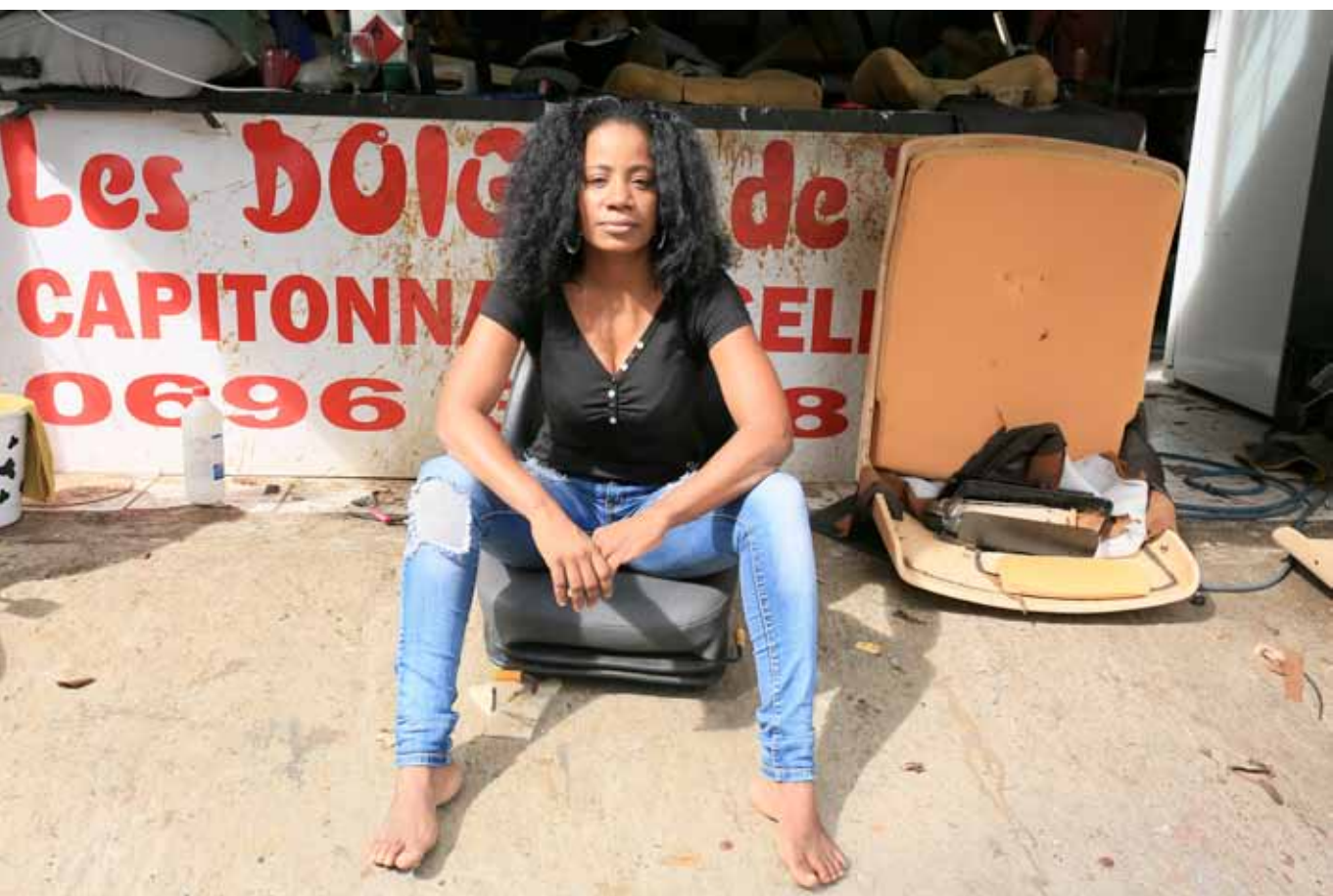
Maryse, Sellerie automobile et maison à Pelletier, le Lamentin