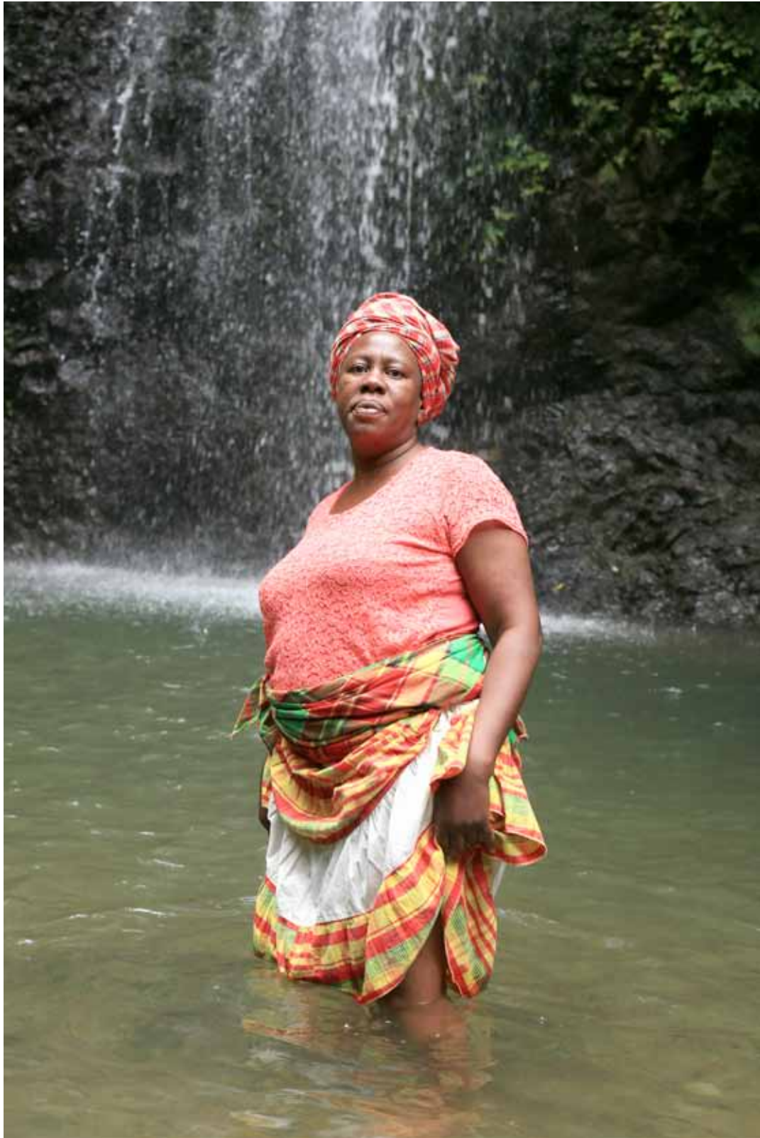
Phatida Produits du Terroir et restauration Fond Saint Denis