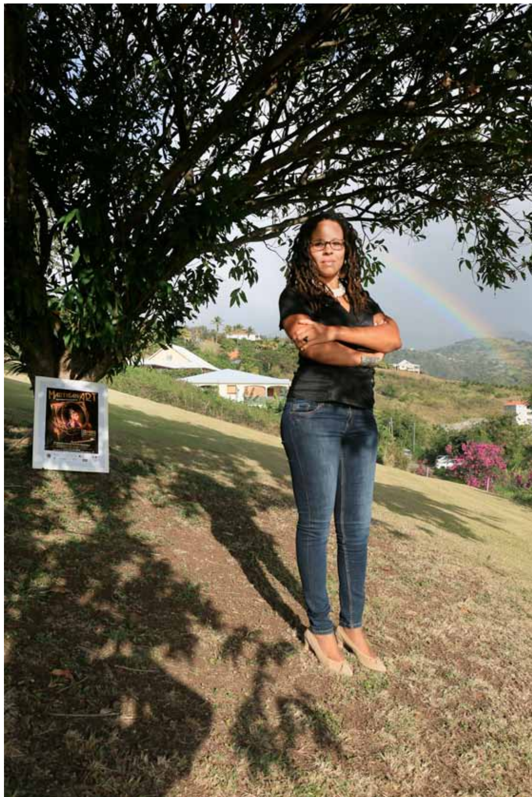
Muriel Graphisme Infographie Le Carbet