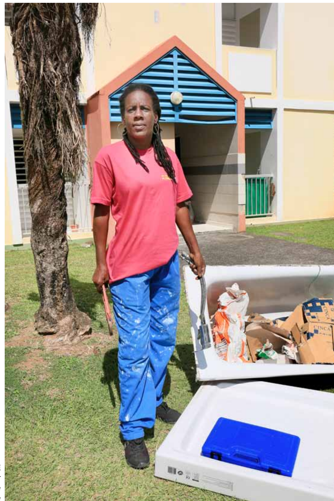
Mimi Plombier et sanitaire Fort de France