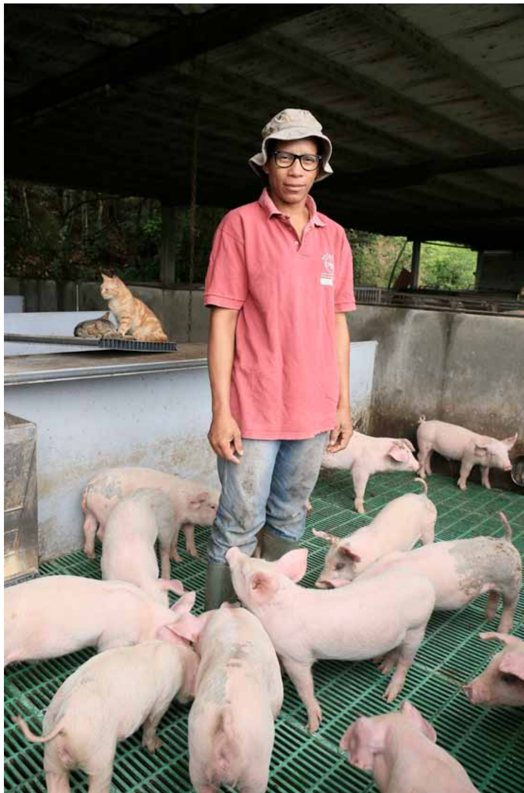
Nadine Elevage Porcin Saint Joseph