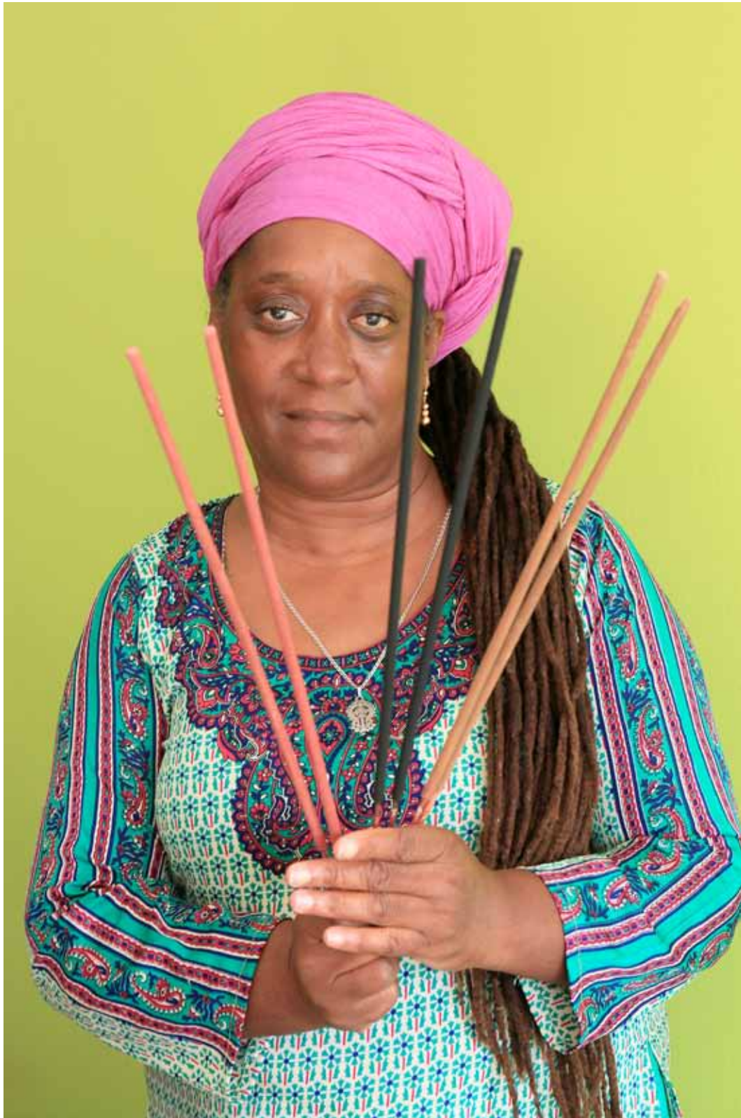
Maryline Fabrication Encens et produits artisans Anses d'Arlet