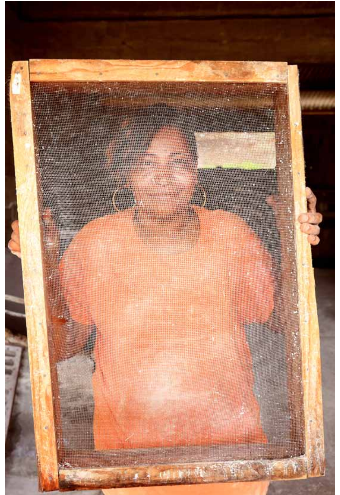
Rosy Fabrication maison de farines Le Lorrain