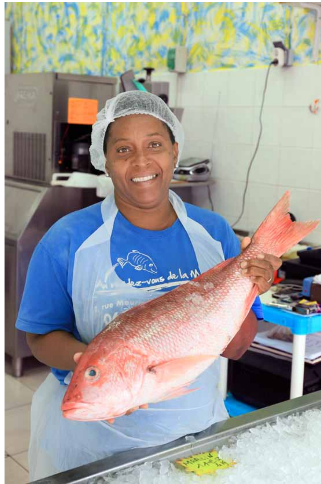
Appolina Poissonerie Saint Joseph