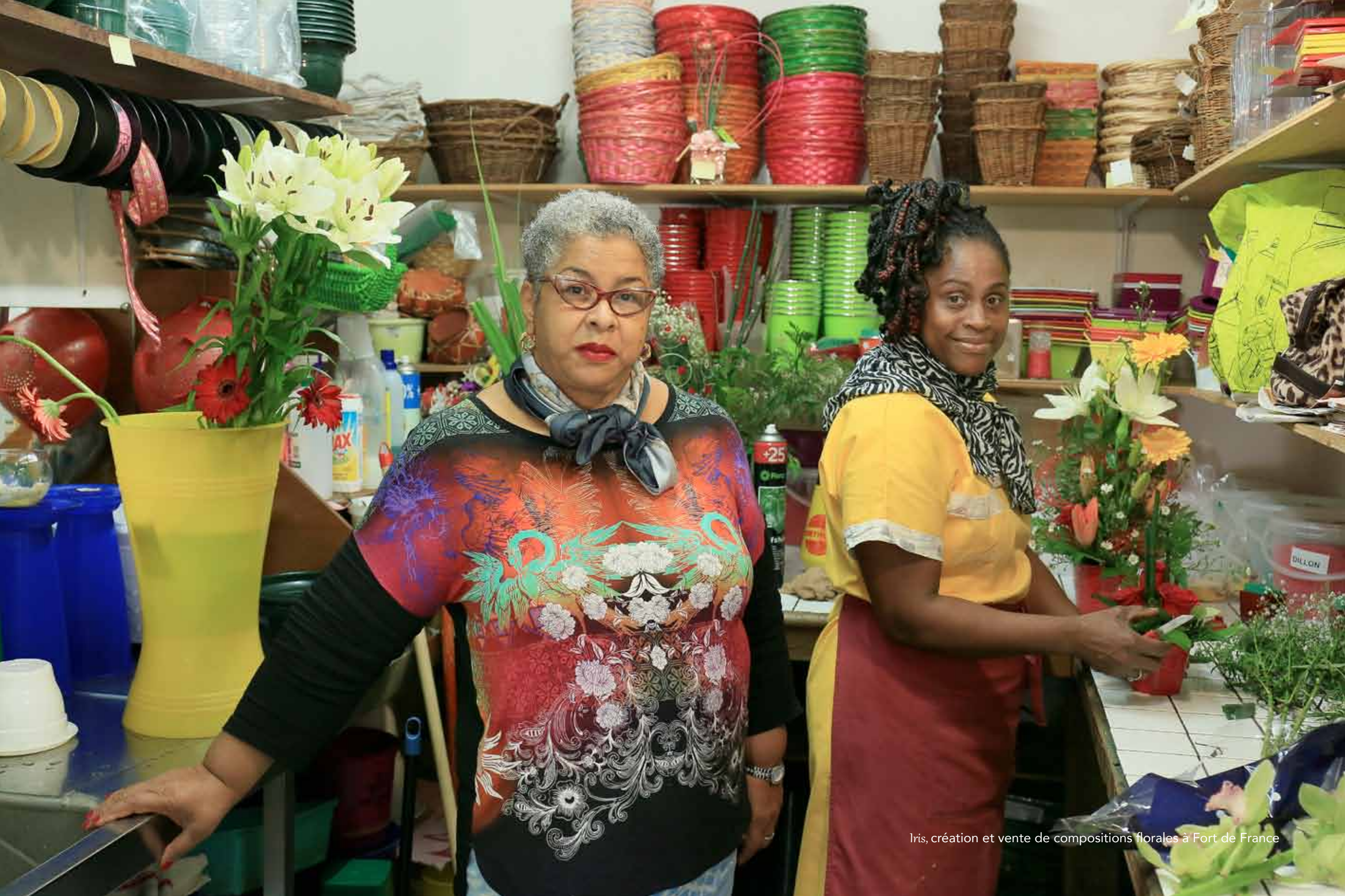
Iris, création et vente de compositions florales à Fort de France