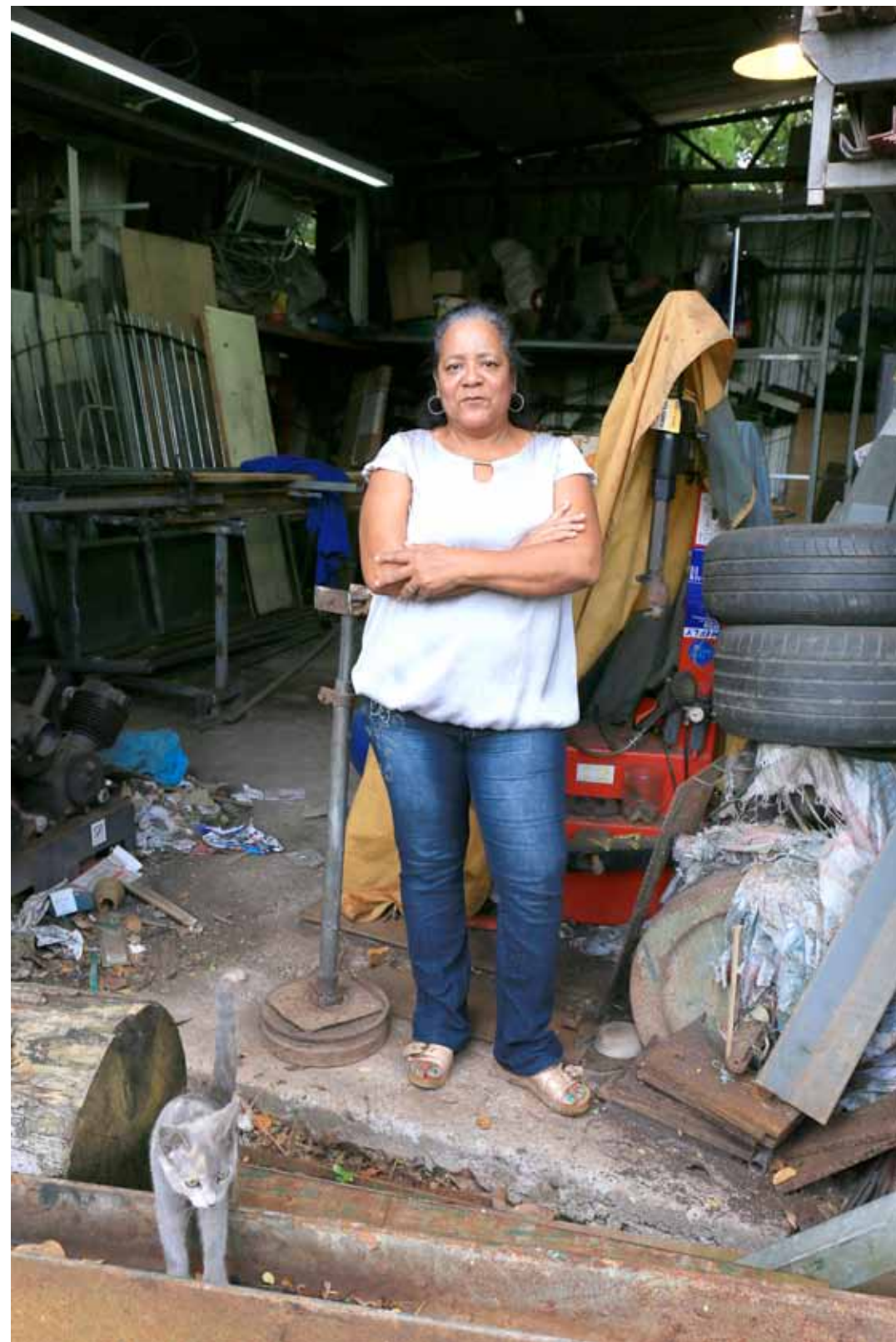
Fabienne Construction et modules en métal Fort de France