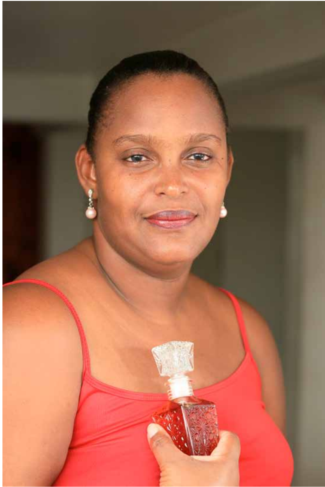
Patricia Production de boissons alcoolisées Fort de France