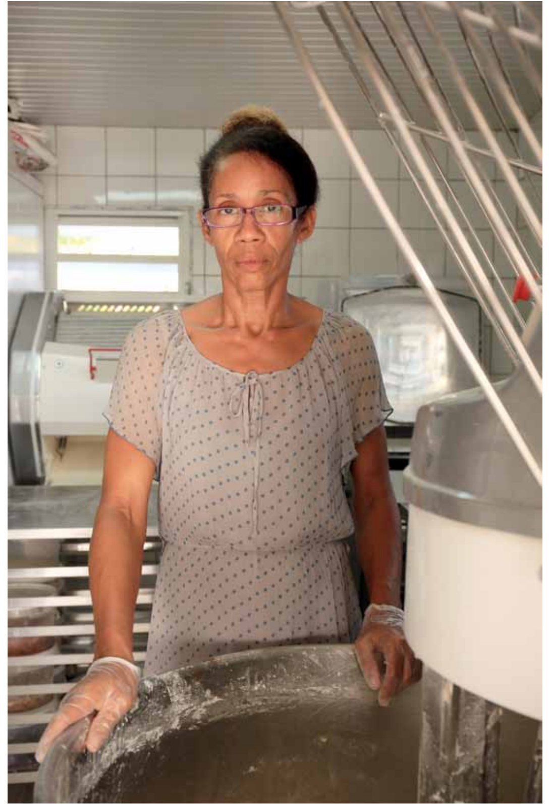
Nicole Boulangerie Pâtisserie à Petit Bourg