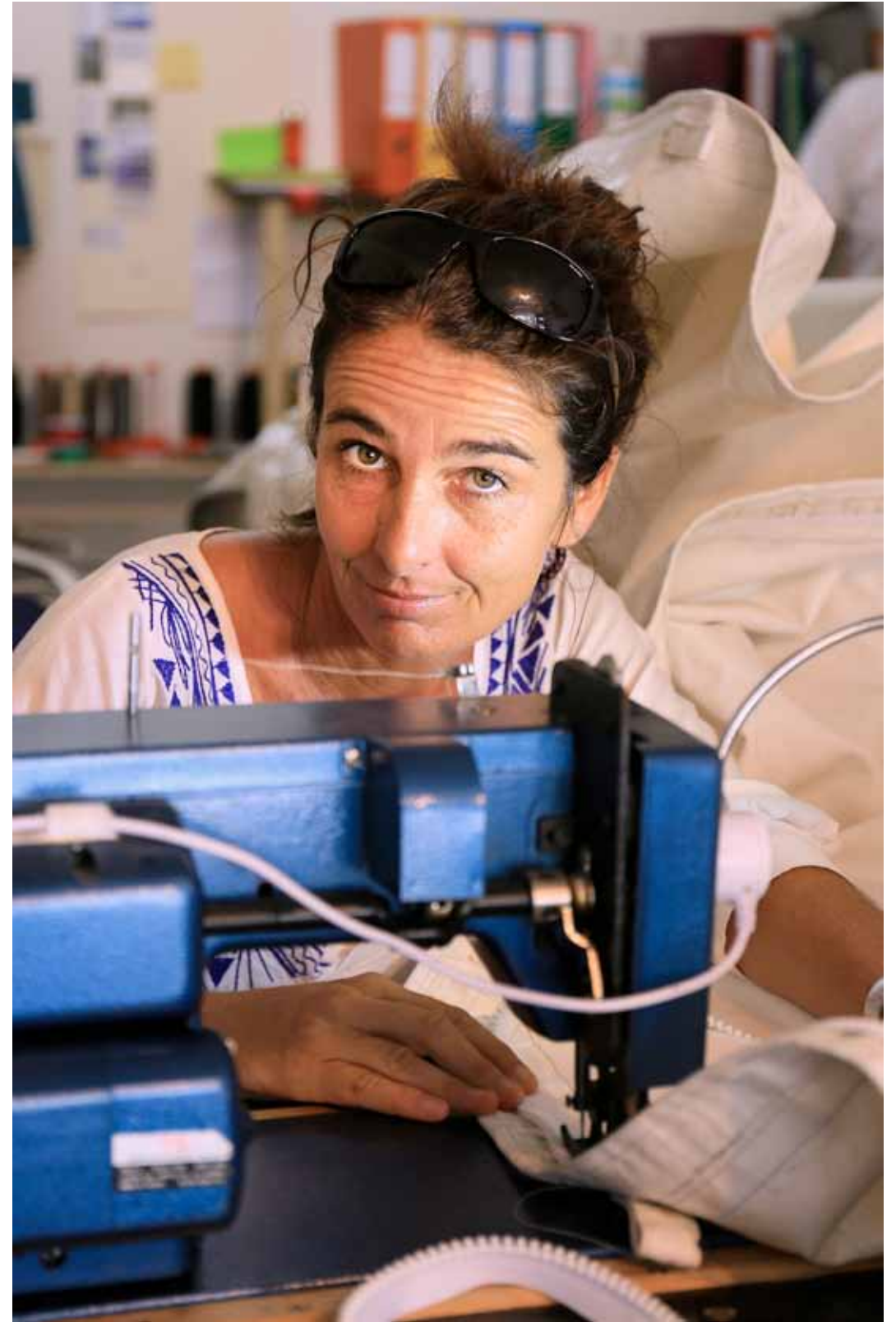
Charlotte Sellerie marine Le Marin